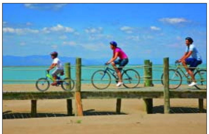
El 25,5% de los turistas que visitan España eligen Catalunya