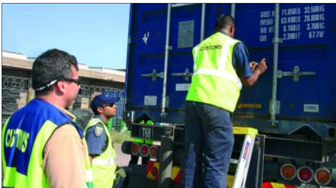
El certificado OEA acredita la seguridad en la cadena logística