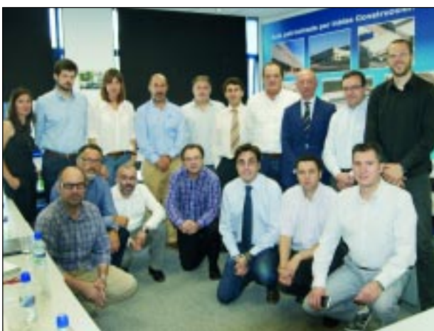
Reunión de los socios del proyecto «Euskadi Camino a la Ciudad Inteligente»