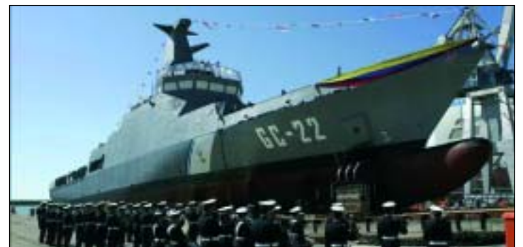
El el 2013 se registró un incremento del 10% de las exportaciones