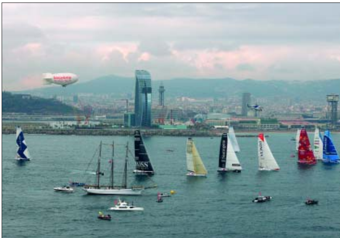
El Campus desea divulgar el potencial formativo asociado a la Barcelona World Race

Jornada de reflexión sobre «Euskadi Camino a la Ciudad Inteligente»